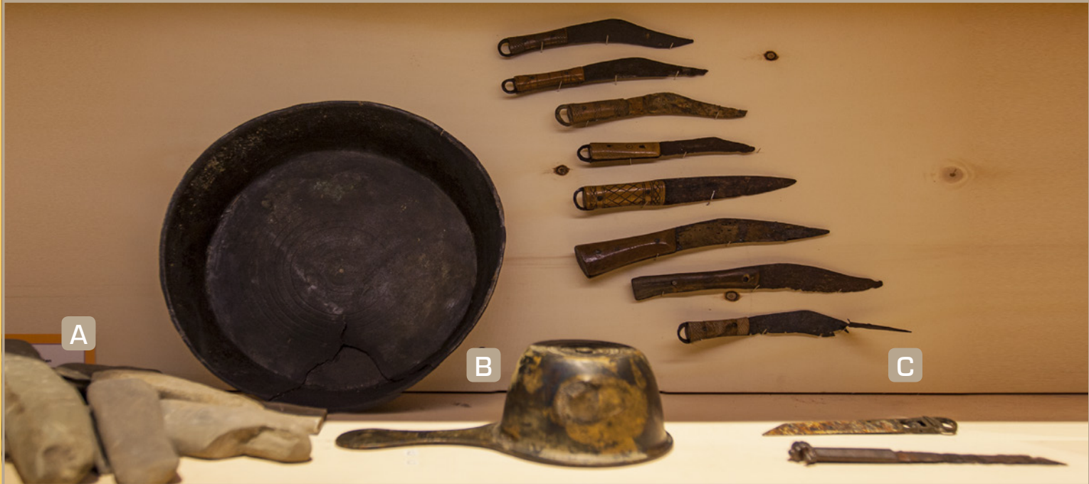
A - Slijpsteenfragmenten | B - Pan ( patera ) | C - Gordelmessen