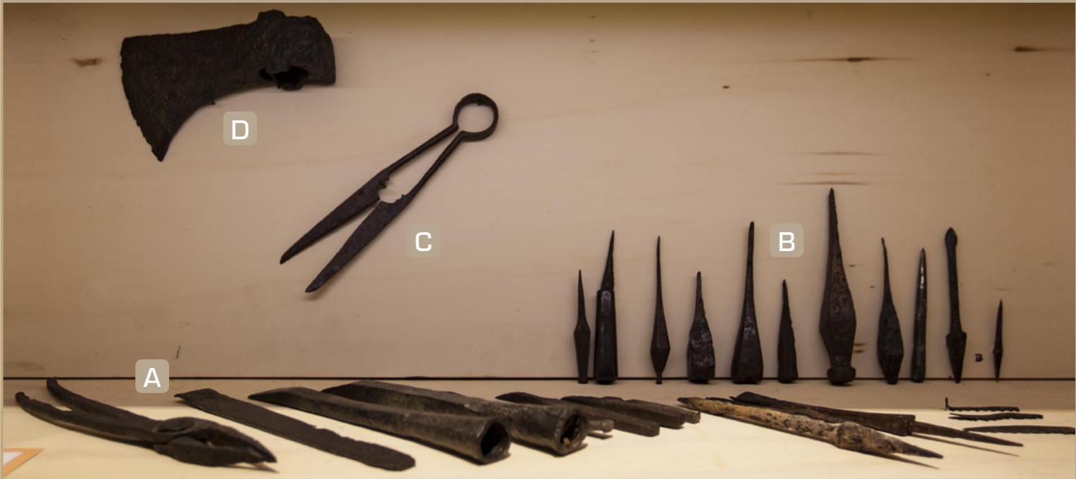
A - Smidstang, beitel, zaagblad | B - Priemen | C - Schaar | D - Bijl